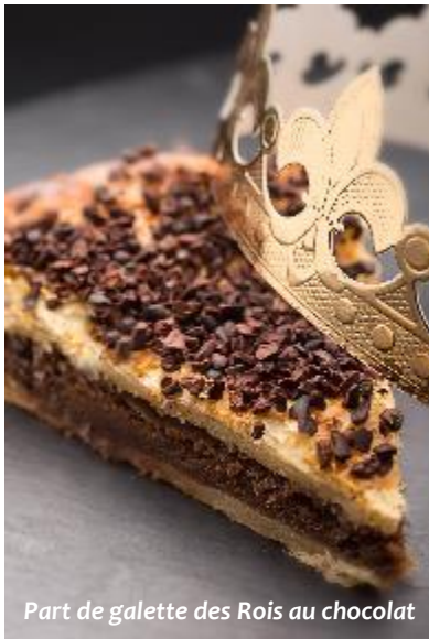
Part de galette des Rois au chocolat