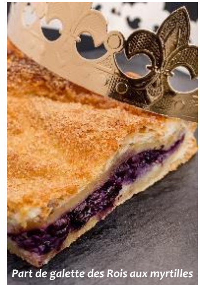
Part de galette des Rois aux myrtilles