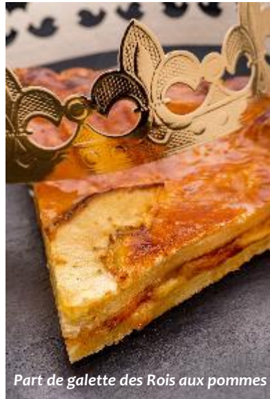
Part de galette des Rois aux pommes