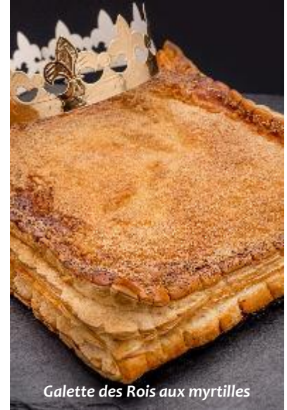
Galette des Rois aux myrtilles