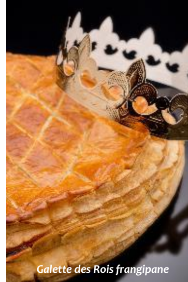
Galette des Rois frangipane