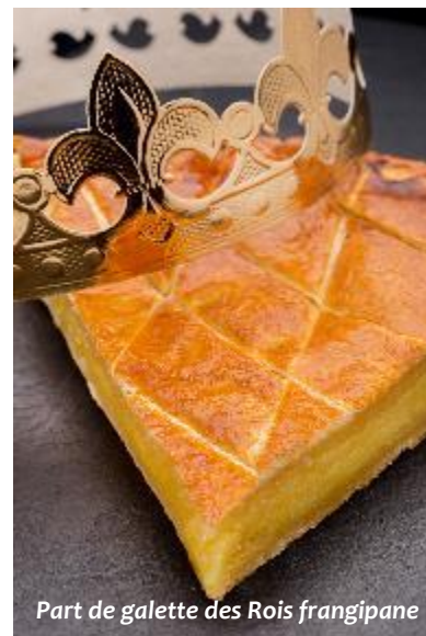
Part de galette des Rois frangipane