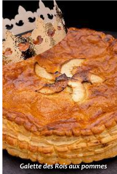
Galette des Rois aux pommes