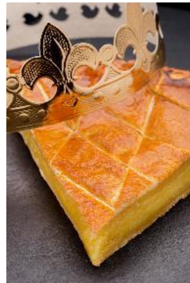
Part de galette des Rois frangipane