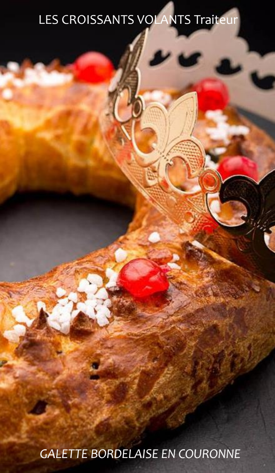
GALETTE BORDELAISE EN COURONNE