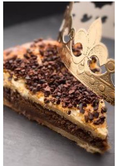
Part de galette des Rois au chocolat