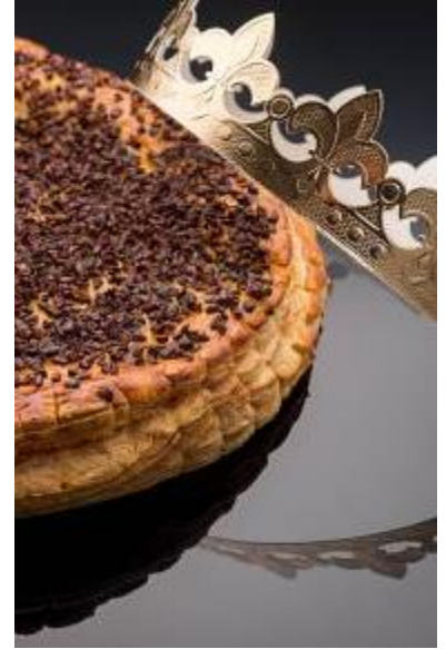
Galette des Rois au chocolat