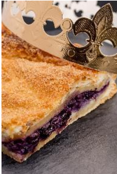
Part de galette des Rois aux myrtilles